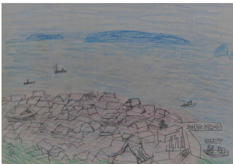
▲松田正平「周防灘 デッサン」