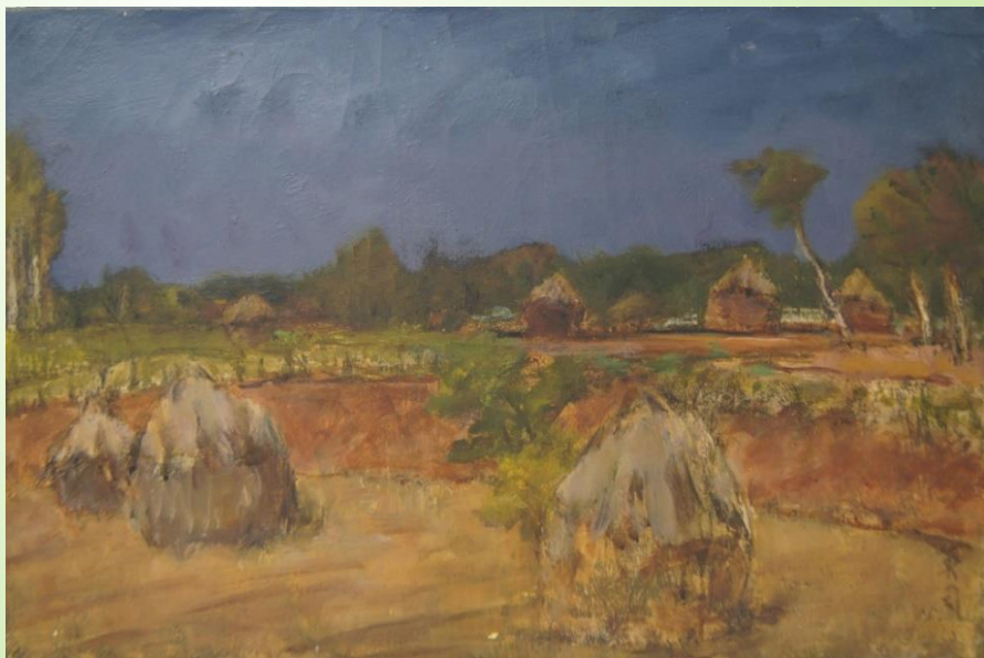
▲川北英司「落花生のうぼっち」1985年