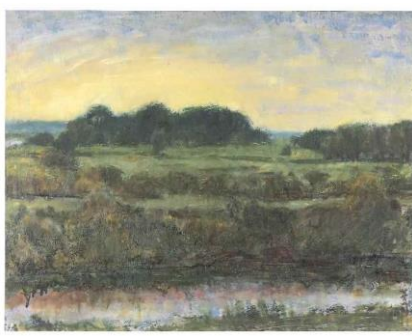
▲川北英司「利根・小貝川合流点」1986年