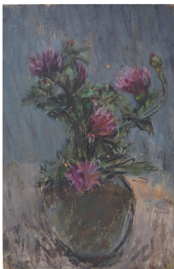
▲川北英司「あざみ」1982年