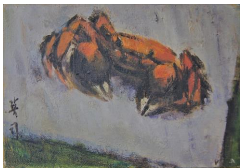
▲川北英司「モクズカニ」1987年