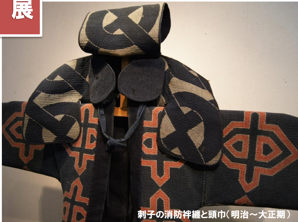
刺子の消防半纏と頭巾(明治～大正期)