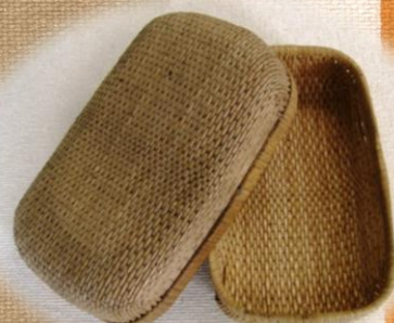
行李(こうり)の弁当箱